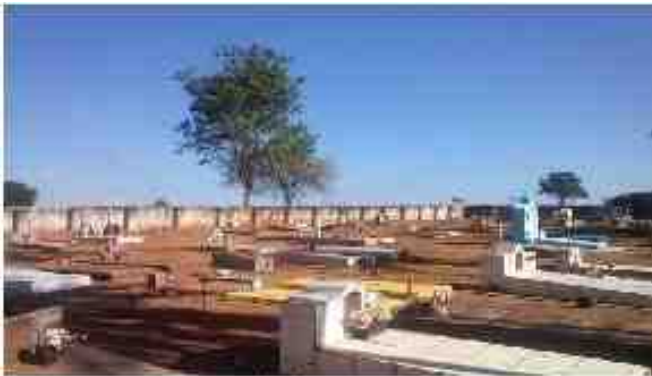
Foto cemitério d