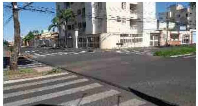
Foto do local