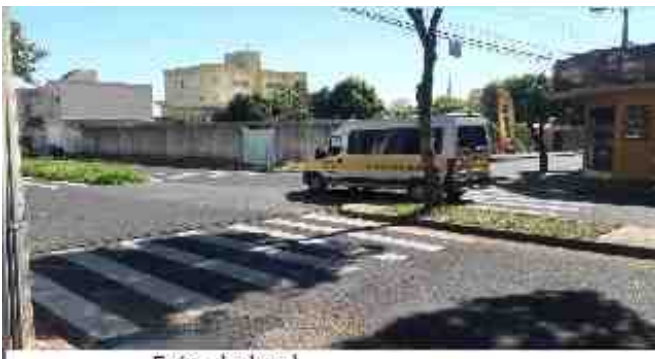
Foto do local