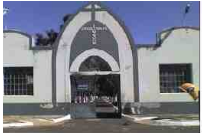
Faoto ilustrata