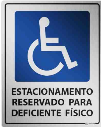
Placa de Estacionamento para Deficientes - Alumínio Tamanhos: 25x20 / 32x40 / 40x50cm