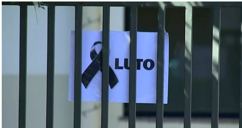
Prefeitura de Uberlândia decretou luto em memória aos mil mortos pela doença na cidade

23/02/2021 17h15 - Atualizado há 2 meses